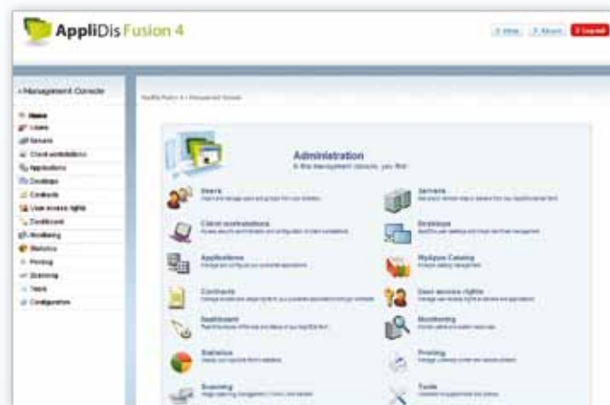
AppliDis Fusion 4 administratie console

Denk aan Video streaming, flash animaties en hoge kwaliteit bi-directionele audio. Externe apparaten worden direct herkend zodra ze zijn aangesloten op basis van door de fabrikant meegeleverde drivers.