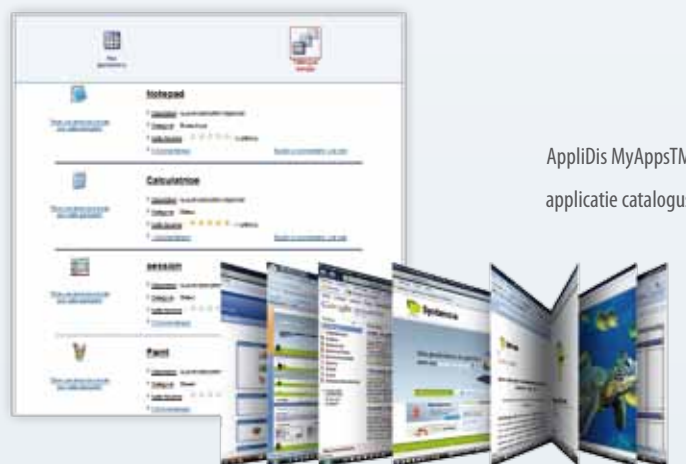
AppliDis MyApps™ applicatie catalogus

AppliDis Fusion 4 beschikt over een uitgebreide technische toolbox om de uitrol te vereenvoudigen. Met de AppliDis Toolbox beschikt u over een groot aantal systeem hulpmiddelen waarmee u de virtualisatie van individuele "registry keys" (voor iedere applicatie), de bestandstoegangen en de identificatie (hostname, IP address...) etc. inricht en vorm geeft.