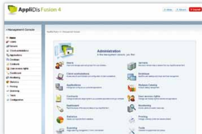
AppliDis Fusion 4 administratie console

Denk aan Video streaming, flash animaties en hoge kwaliteit bi-directionele audio. Externe apparaten worden direct herkend zodra ze zijn aangesloten op basis van door de fabrikant meegeleverde drivers.